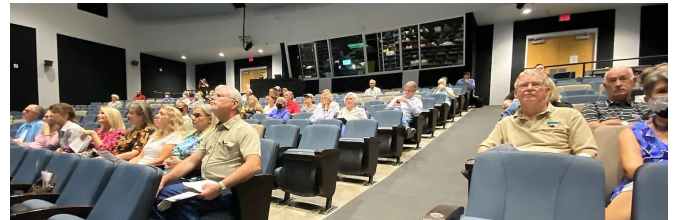
Asistentes al mapa de cuadrícula