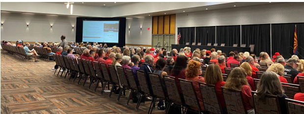
PRINCIPAL Asistentes a la reunión del mapa de cuadrícula de Tucson. 29 de septiembre de 2021 de Scottsdale. 29 de septiembre de 2021