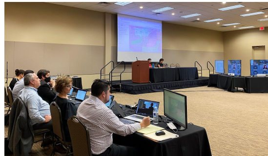
Mapeo del personal, abogados e IRC en Desert Willow Centro de Conferencias de Phoenix